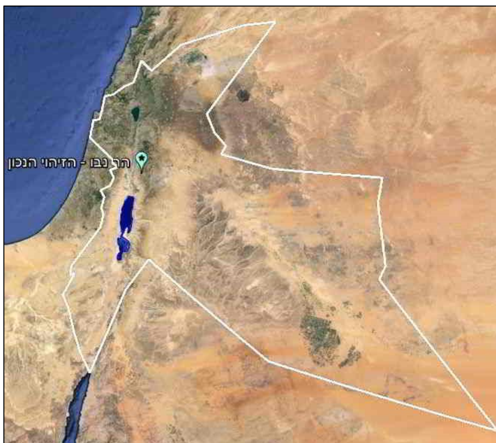
איור 107: שדה הראיה מהר נבו

קורא יקר, רציתי לאפשר גם לך להתפעל מכך. בכדי לבחון שאלו אכן מימדי שדה הראיה, תוכל להשתמש בכלי הנקרא 'קו הראייה מהר נבו' שבקובץ הממצאים (בספריה 'הר נבו'). אהרון נקבר על פסגת הור-ההר, שהוא אפילו גבוה יותר מהר נבו (1298 מ') וגם משם ניתן לראות את כל הארץ. נסה את "קו הראיה מהור-ההר" שבספריית "הלולאה השנייה" בקובץ הממצאים.