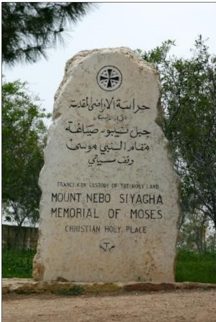
איור 106ב: ציון האתר בכנסייה

המחזיקים בדעה זו מסתמכים על הפסוק: וַיִּקְבֹּר אֹתוֹ בְּגִי בְּאֶרֶץ מוֹאָב מוֹל בֵּית פְּעוֹר (דברים לד, 6). אלא שזיהוי זה שגוי משום ש: